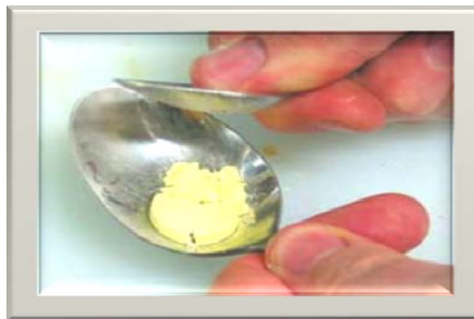
شکل ۲. مقدار قرص تجویز شده در قاشق خرد و در آب حل شده و به نوزاد خورانده شود

روش دوم: مانند روش اول قرص را نصف کنید و تکه‌های قرص را داخل قاشق بریزید و با ته قاشق دیگری روی محتویات قاشق اول فشار بیاورید تا کاملاً خرد شود. سپس چند قطره آب اضافه کنید و قرص را کاملاً حل کنید. سپس این محلول را به کودک بخورانید. مجدداً داخل قاشق را چند قطره آب بریزید و به نوزاد بدهید.